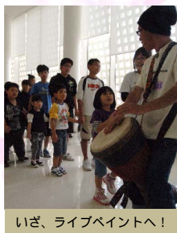
いざ、ライブペイントへ！