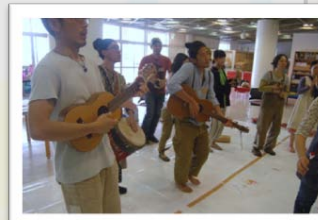
音楽スタッフによる生演奏。見慣れない楽器に子ども達も興味津々！