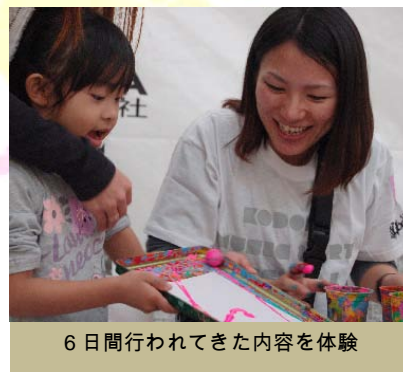
6日間行われてきた内容を体験

ワークショップに参加してくれた子ども達のほとんどが、ステージで行われているライブペイントにも出演しました。