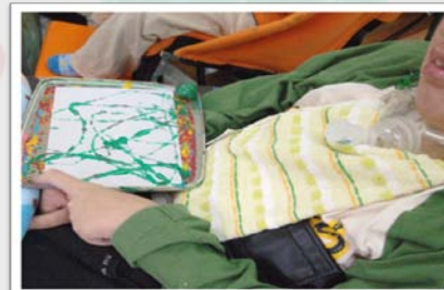
ビー玉を転がして描く「コロコロドローイング」。年齢問わず、どんな環境にいても楽しめる大人気の内容！