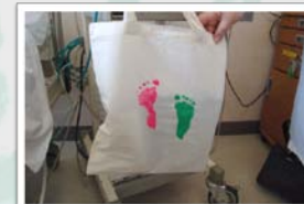
小児病棟の子ども達へは、作った作品と一緒に手形・足形をした布バッグとDKSHの色鉛筆をプレゼントしました！

サンゴや海の砂を用いた沖縄ならではの内容は、素材自体について伝えながら子ども達は、楽しむだけでなく学びながら参加！最後にはとても素敵な作品が出来上がり、一人一人思い出として持ち帰りました。